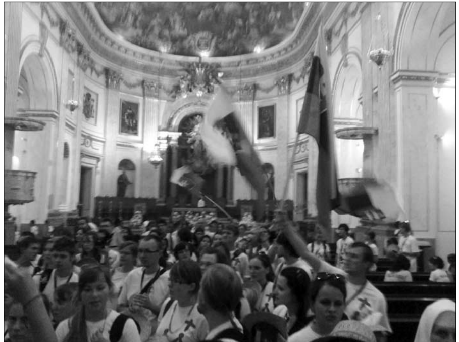
Slovenské vlajky v katedrále v Segorbe