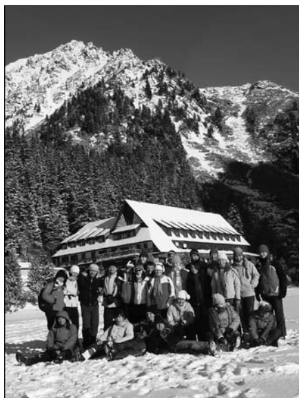
Výlet v Tatrách

Dňa 1. januára 2011 sa na markušovskej fare uskutočnil už tradične vianočný miništrantský turnaj v štyroch disciplínach: šachu, dáme, piškvor-